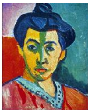
HENRI MATISSE - PESTRE BAREV

Slovenski slikar Ivan Grohar je na zgornjem likovnem delu uporabil manj pestre barve. Barve je veliko mešal med seboj. Uporabil je veliko bele barve.