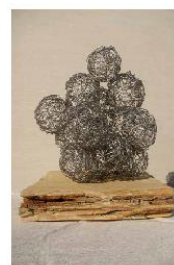
KIP KIPARKE KATJE SMERDU