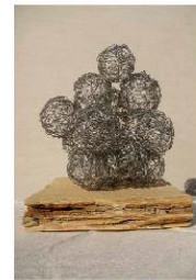
KIP KIPARKE KATJE SMERDU