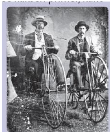
Prevoz v preteklosti