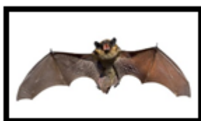
A BAT – netopir