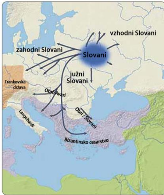
Slika 232: Smeri razseljevanja Slovanov