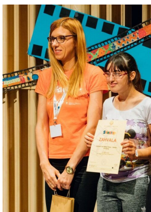
3. mesto za naš video »Mlinček«

Na finalni prireditvi projekta Video S-Factor 2017, 18. maja 2017 se je v KC Semič veliko dogajalo. Na dopoldanskih delavnicah v okviru festivala Igraj se z mano se je družilo preko 600 udeležencev vseh starosti: učenci s posebnimi potrebami, učenci osnovnih šol in vrtca, prostovoljci različnih generacij in narodnosti, mentorji delavnic, upokojenci in obiskovalci z vseh koncev Slovenije in iz tujine.