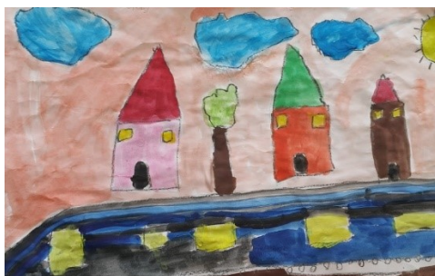
Aleksej Brezar, 4. razred

V šolskem letu 2017/2018 se bo nacionalno preverjanje znanja izvajalo 4., 7. in 9. maja 2018.